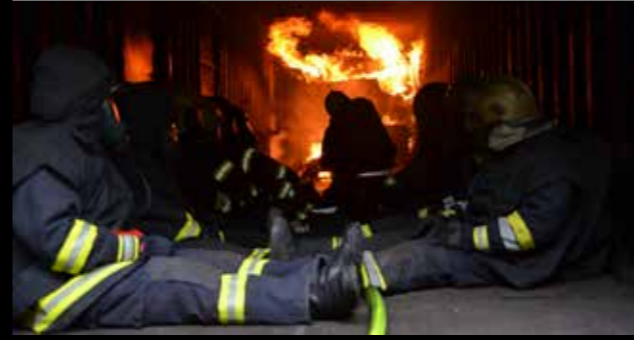
Einsatz der Wärmebildkamera

Die "Feuertaufe" eines Atemschutzträgers soll im kontrollierten Ausbildungsverlauf stattfinden, nicht im unberechenbaren Ernstfall