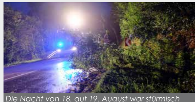
Die Nacht von 18. auf 19. August war stürmisch

Es hätte ein gemütlicher Abend werden sollen, schließlich fanden sich viele Kameraden von Feuerwehr, Rotem Kreuz, Polizei, Gemeindeamt und Ärzte zum "1. Rohrbach-Berger Blaulichtgrillen" im Feuerwehrhaus ein. Um 23:23 Uhr wurde es dunkel in der Stadt, der Strom fiel aus, Sturmböen fegten über das Mühlviertel. Unsere Feuerwehr hatte in Summe 9 Einsätze im eigenen Gebiet abzuarbeiten. Umgestürzte Bäume auf Stromleitungen oder Straßen, aber auch ein steckengebliebener Lift waren die Einsatzgründe. Die Bezirkswarnstelle wurde besetzt und musste weitere 12 Feuerwehren im Bezirk zu verschiedensten Einsätzen alarmieren. Viele Sirenen blieben auf Grund des Stromausfalles jedoch stumm - laut Alarmplan waren daher unzählige telefonische Verständigungen durchzuführen.