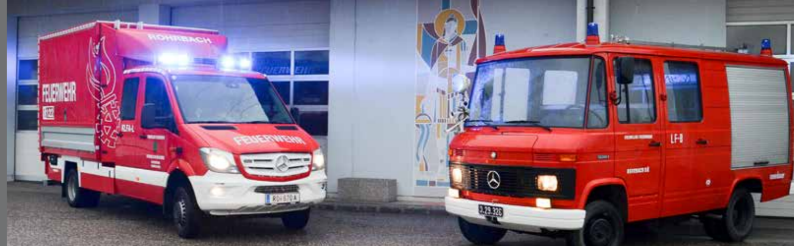
Funkrufname: "Pumpe Rohrbach" KLFA-L Baujahr 2017