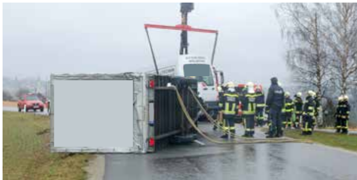
18. März in Lanzerstorf: 25 Frau/Mann waren mit 4 Fahrzeugen 70 Minuten im Einsatz

Im Februar, März, Juli und August sorgten Stürme für zahlreiche Einsätze unserer Wehr. So mussten wir den Bahnkörper der Mühlkreisbahn von umgestürzten Bäumen befreien, damit diese ihren Betrieb wieder aufnehmen konnte. Ein Sonnenschirm wurde vom Winde verweht und blieb im Stadtgebiet in einer Dachrinne hängen. Ein Anhänger wurde von einer Böe erfasst, stürzte um und hob dabei das Zugfahrzeug an der Hinterachse an. Die Feuerwehr sicherte das Zugfahrzeug mit dem Kranfahrzeug und stellte mit der Seilwinde des Rüstlöschfahrzeuges den Anhänger auf. Beim Sommersturm gab es viele umgestürzte Bäume und somit jede Menge Verkehrswege zum Freimachen. Ein Baum stürzte auf eine Stromleitung und blieb darin hängen.