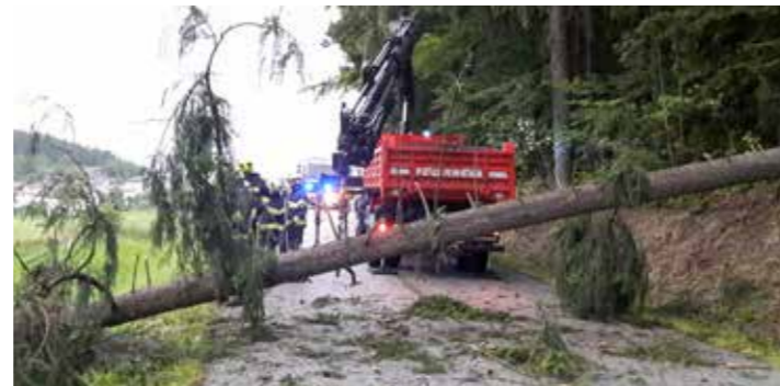
Einsatz wegen Sturm am 20. Juli um 19:31 Uhr in Hehenberg