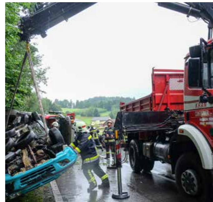
24. Juli in Nöblbach - LKW stürzt um und verliert Schrottautos

des umgestürzten LKWs gehörten und es eigentlich keine Verletzten gab. Die Feuerwehr unterstützte das Bergungsunternehmen beim Freimachen der Straße, welche für ca. 3 Stunden gesperrt war.