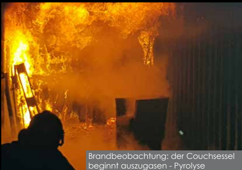
Brandbeobachtung: der Couchsessel beginnt auszugasen - Pyrolyse

Um im Einsatz die richtigen Maßnahmen im jeweiligen Brandstadium zu setzen, muss speziell der Brandverlauf jedem Feuerwehrmitglied bekannt sein. Um dieses Wissen zu vermitteln wird vor den Durchgängen im Brandcontainer der Brandverlauf mittels FO-Box (Flash-Over-Einraumbox) und Dollhouse (Vierraumbox) an die Teilnehmer weitergegeben. Hier können die Feuerwehrmitglieder vorab, ohne die zusätzlichen Belastungen wie Hitze und Sicht Einschränkung im Container, den Brand in all seinen Stadien, vom Entstehungsbrand bis zum Vollbrand, beobachten und gemeinsam mit einem Ausbilder analysieren.